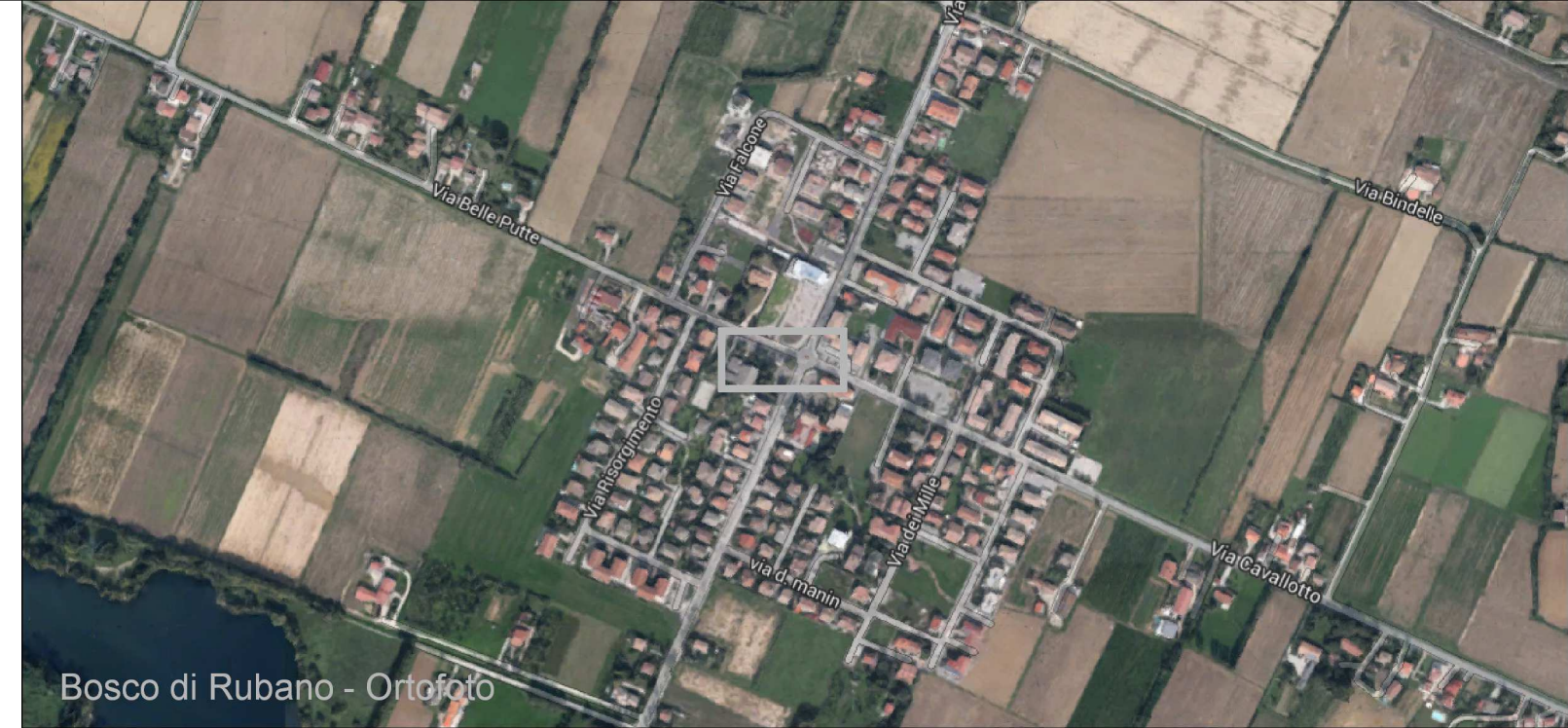
Bosco di Rubano - Ortofoto